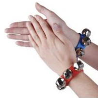
PULSERA DE CASCABEL